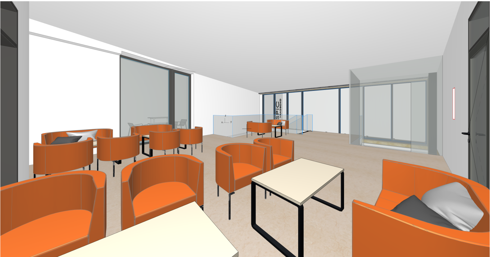
vizualizace galerie v druhém patře

ZAŘÍZENÍ - dvířka rozdělovače podlahového vytápění v barvě stěny