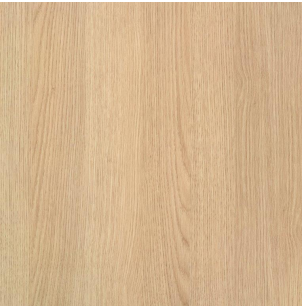
lamino - nábytek